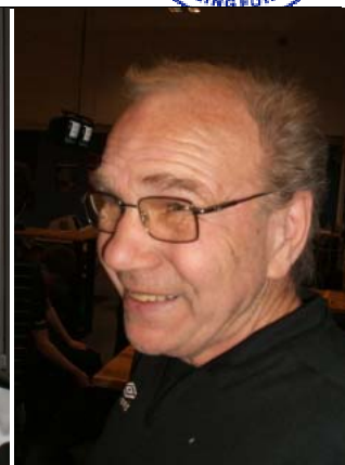
Roar Hansen Sparring BK